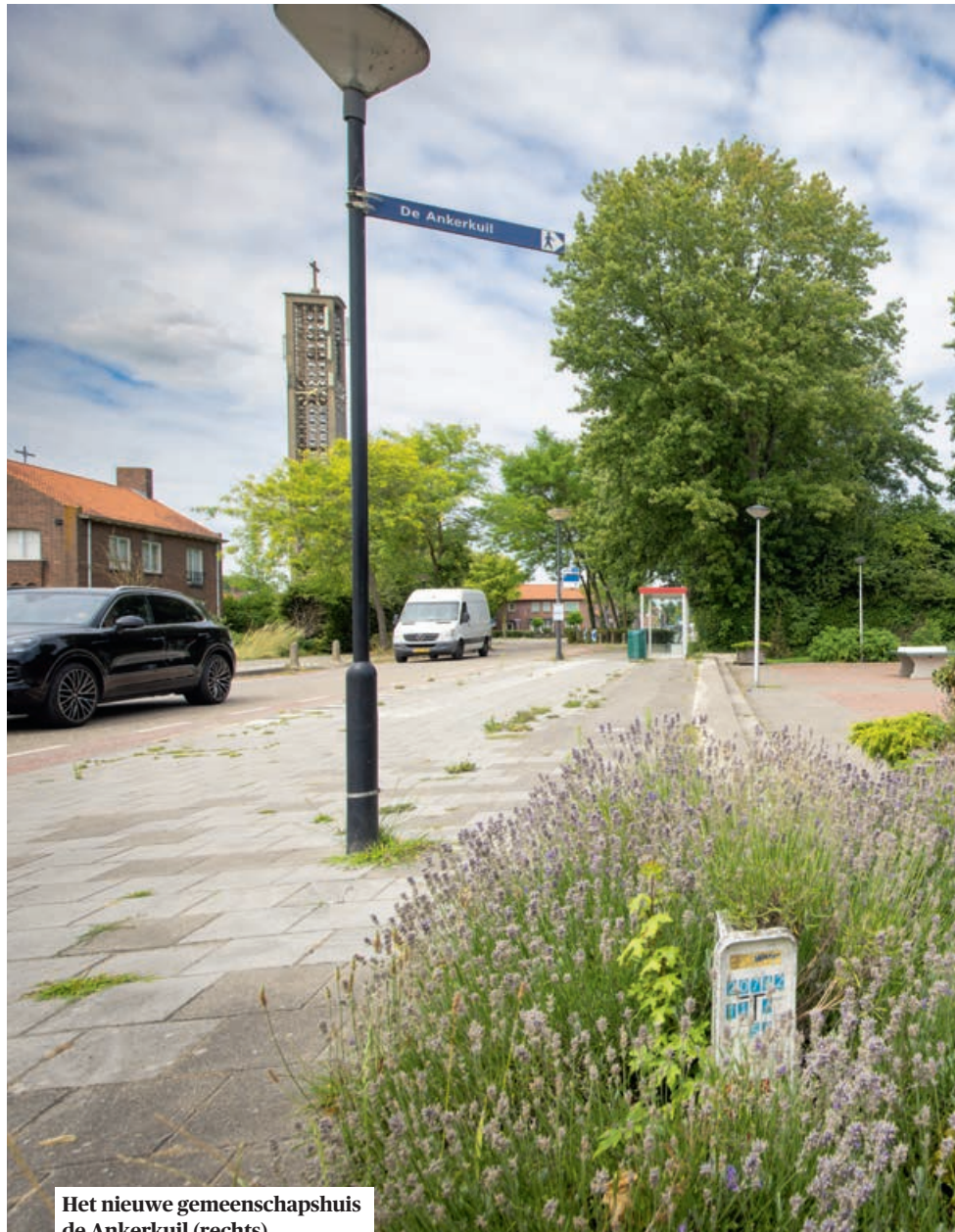
Het nieuwe gemeenschapshuis de Ankerkuil (rechts)

De dorps haven moet het pronkstuk worden van de wederopstanding van het dorp Moerdijk. Tien jaar geleden is de gelijknamige gemeente ermee begonnen. Tijdens een zomerse ochtendwandeling door het dorp, langs het haventje en door het aangrenzende natuurgebiedje de Appelsak, vertellen Dingemans en twee van zijn ambtenaren enthousiast wat de gemeente afgelopen jaren samen met de inwoners voor elkaar heeft gebokst. De bouw van